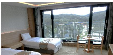
ヤンヤンインターナショナルエアポートホテル内の様子