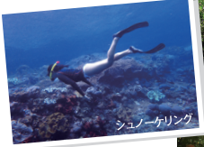
シュノーケリング

※水着着用の上、濡れても良い軽装でお越しください。 ※ビーチャトール、サングラス、日焼け止めを持参をお願いします。