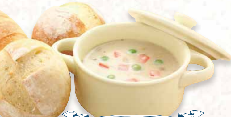
Stew & Bread