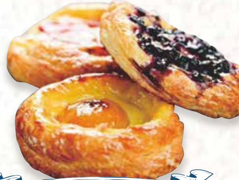
Pie & Pastries