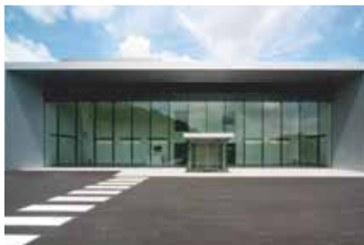
JQA多摩テクノパーク